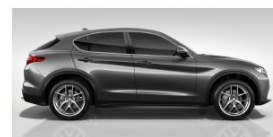
GRIGIO VESUVIO 5CE