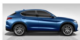
MISANO BLUE 5DS