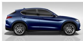
MONTECARLO BLUE 5CD