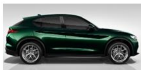
VERDE VISCONTI 5DR