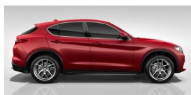
ALFA ROSSO 5CA