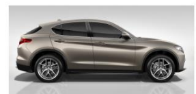
TITANIO IMOLA 5DN