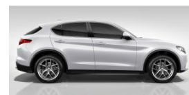
BIANCO TROFEO 4SA