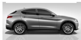
GRIGIO STROMBOLI 5CC