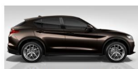
BROWN HEARTH 61P