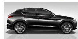
VULCANO BLACK 58B