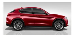
ROSSO COMPETIZIONE 270

Pilot Motors OÜ, Läike tee 32/2 Harju maakond, Rae vald, Peetri alevik 75312, Tel. +372 655 9590, info@pilotmotors.ee