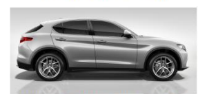
GRIGIO SILVERSTONE 210