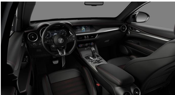
646 | Must nahast Tributo Italiano istmed ja polster punaste aktsentidega